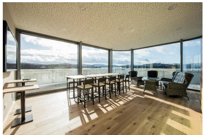
Tafel + Lounge